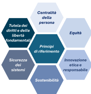
Figura 2 - I principi fondanti della strategia per l'introduzione dell'IA

La strategia per l'introduzione dell'IA è guidata dai seguenti principi di riferimento che costituiscono il fondamento delle politiche e delle azioni intraprese dal Ministero per affrontare con decisione e responsabilità le sfide del futuro, in coerenza con i valori costituzionali, a partire da quelli riconosciuti negli articoli 2 e 3 Cost., delineati ed ulteriormente articolati nelle politiche educative nazionali (art. 9, comma 1 Cost.) ed europee (art. 14 Carta dei diritti fondamentali dell'UE) 3 .