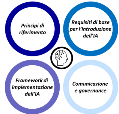
Figura 1 - I pilastri alla base del modello di introduzione dell'IA nelle scuole