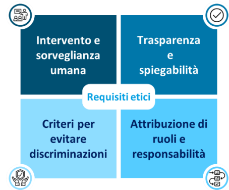
Figura 3 - I requisiti etici per l'utilizzo dell'IA

L'utilizzo sempre più consistente dell'IA nel mondo scuola solleva importanti implicazioni etiche che devono essere affrontate con attenzione per assicurare un impatto positivo e sostenibile, in linea con i principi trainanti le azioni del Ministero. È perciò fondamentale utilizzare tale strumento in modo da assicurare il rispetto di norme e principi etici, così che l'IA possa rappresentare uno strumento affidabile e inclusivo al servizio della comunità scolastica.